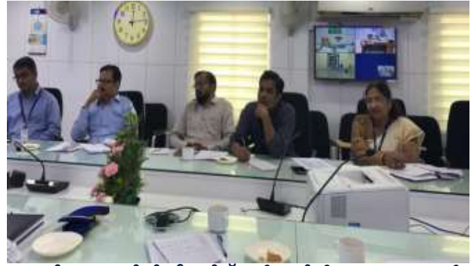
ബാങ്കിനെ പ്രതിനിധീകരിച്ച് ചർച്ചയിൽ പങ്കെടുത്തവർ

എസ്.ബി.ഐ. പെൻഷനേഴ്സ് അസ്സോസിയേഷന്റെ ആലപ്പുഴ/കോട്ടയം പ്രതിനിധികളും ബാങ്ക് മാനേജ്മെന്റ് പ്രതിനിധികളും മുഖാമുഖം.