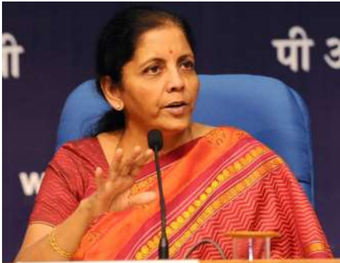
പാർലമെന്റിൽ 2020-21 വർഷത്തെ ബജറ്റ് അവതരിപ്പിക്കുന്ന കേന്ദ്ര ധനകാര്യമന്ത്രി നിർമല സീതാരാമൻ

ധനകാര്യമന്ത്രിയുടെ സഹായത്തോടെയാണ് രാഷ്ട്രപതി ഇപ്രകാരം ചെയ്യുന്നത്. 2016 വരെ എല്ലാ വർഷവും ഫെബ്രുവരിയിലെ അവസാനത്തെ പ്രവൃത്തി ദിവസമാണ് കേന്ദ്ര ധനകാര്യമന്ത്രി പാർലമെന്റിൽ ബജറ്റ് അവതരിപ്പിച്ചിരുന്നത്. എന്നാൽ 2017 മുതൽ ഫെബ്രുവരിയിലെ ആദ്യ ദിനം (ഫെബ്രുവരി ഒന്നിനാണ്) ആണ് ബജറ്റ് അവതരിപ്പിക്കുന്നത്. ഇന്ത്യയിൽ സാമ്പത്തിക വർഷം ആരംഭിക്കുന്ന ഏപ്രിൽ ഒന്നിന് കേന്ദ്ര ബജറ്റ് നടപ്പിൽ വരുന്നു. അതിനു മുമ്പായി ബജറ്റ് പാർലമെന്റിൽ ഇരുസഭകളിലും വോട്ടെടുപ്പോടെ പാസ്സാക്കേണ്ടതുണ്ട്.