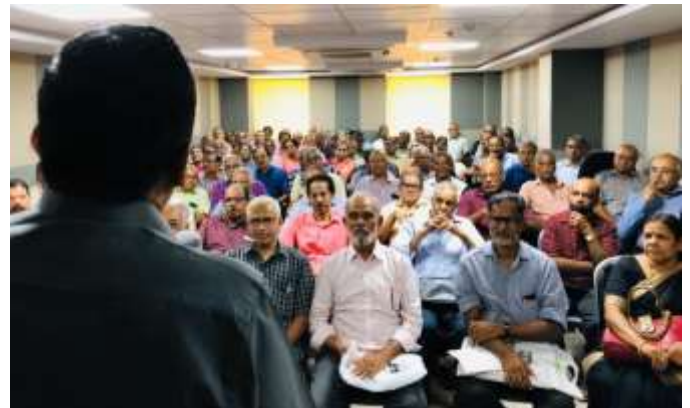
പെൻഷൻകാരുടെ തിങ്ങി നിറഞ്ഞ സദസ്സിലായിരുന്നു അവതരണം.